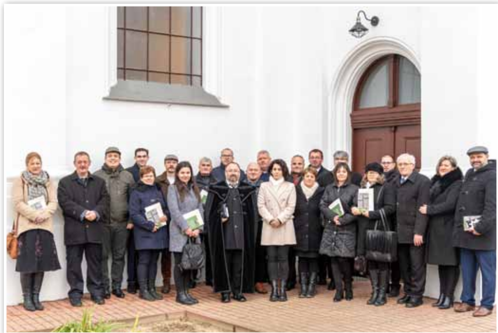
Az új presbitérium